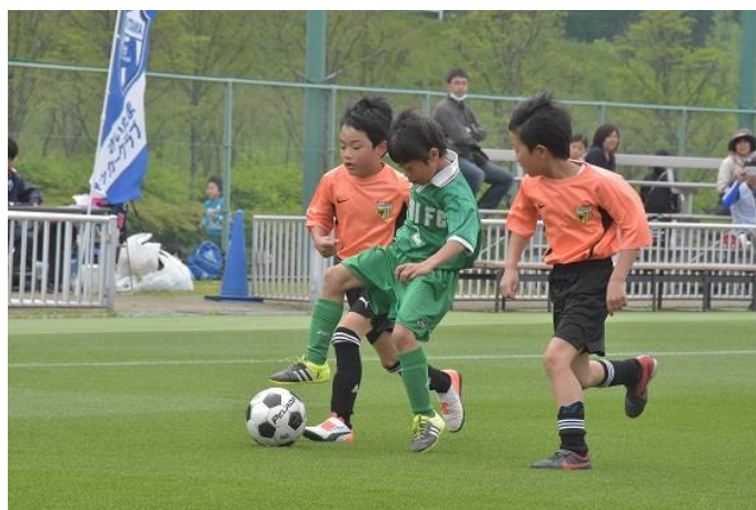
▲15分ハーフではありますが、交代はほぼなし。とにかく、みんなでボールを追いかけていました。