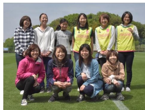
▲選手入場のセレモニーでは、子どもたちがエスコートキッズとして、お母さんたちも参加していただきました。