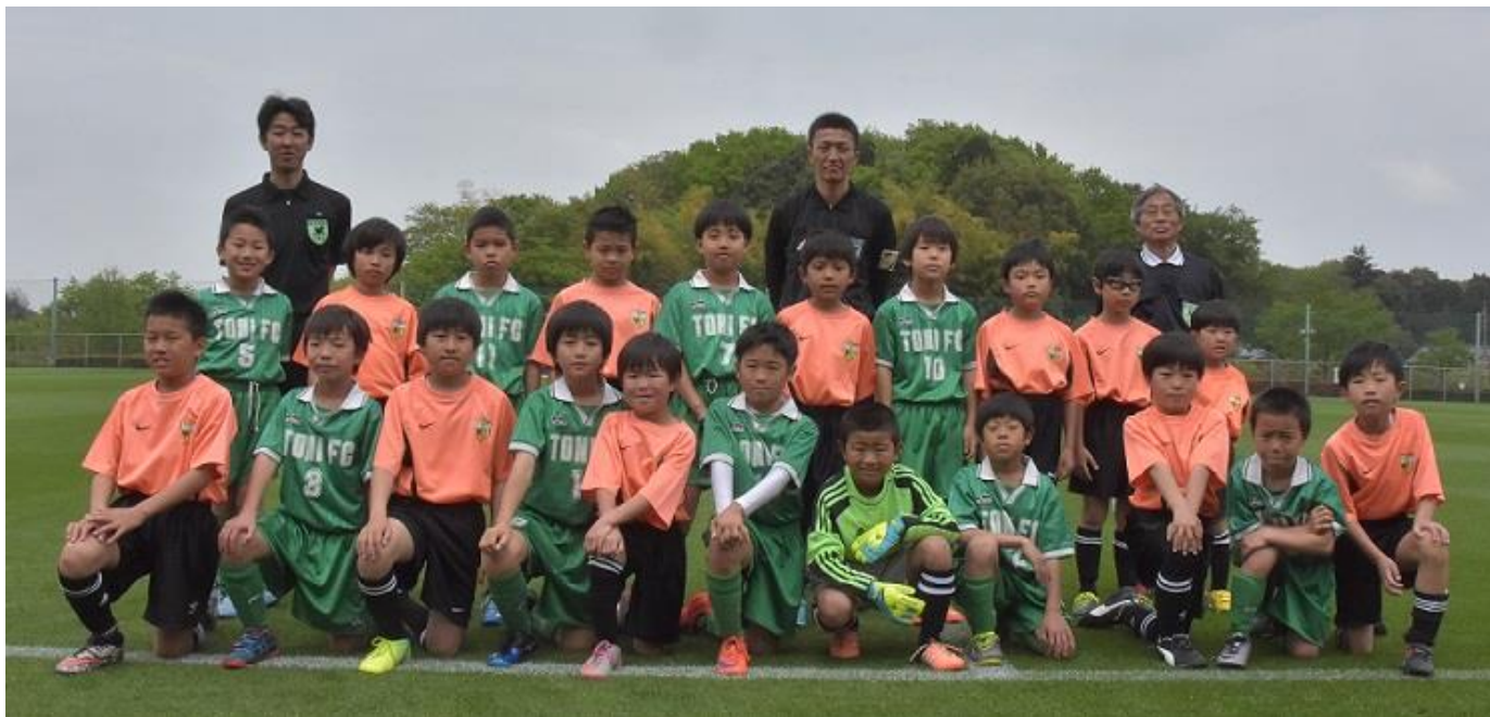
▲本日のボーイズマッチ（仮称）は、大和田FCと戸二サッカー少年団の四年生の子どもたちでした。フルピッチで11人制のはずが……。ご容赦を！